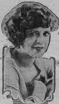
Clara Bow in the Paramount Picture "Get Your Man"

Tanda de moda en el Moderno hoy a las 7 p. m. Osequio de tarjetas — No lo dejes escapar por Clara Bow